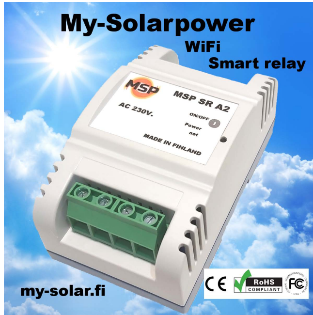
MSP-SR-A2, etukannessa kosketus kytkin ja LED-ilmaisimet (tulevat näkyviin kun laite kytkeyty).

MSP-SR Smart Releet on suunniteltu DIN-kiskoon asennettaviksi. Rele sisältää oman Sähkämittarin ja sitä voidaan ohjata SMA Home Manager 2.0 tai ilmaisilla puhelin sovelluksella. Voit määrittää tuotteelle käyntiajat tai milloin on lupa toimia. Voit ohjata relettä mistä vain ja katsoa paljonko sähköä kuluu releen läpi. Max 16A antaa sinulle paljon mahdollisuuksia käyttää relettä ja tuo turvallisuutta kotiin. Releitä voi olla useita ja niille voidaan antaa eri käynnistymisarvot samasta ohjauksesta. Voit laittaa myös kulutus rajoituksen, jolloin tulee hälytys ja laite kytkeytyy pois päältä.